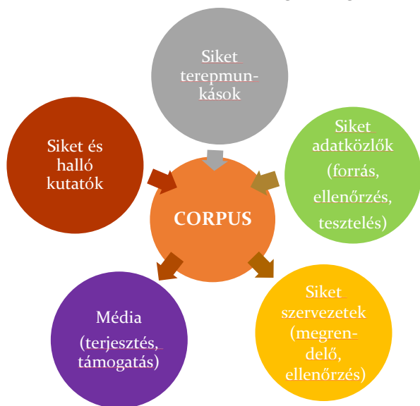
2. ábra: A projekt megvalósítói

A jelnyelvi törvény implementációját támogató kutatásoknak számos célja van: ilyen a jelnyelvsztenderdizációja, a jelnyelvi tolmácsolás és tolmácsolás fejlesztése, a bilingvális siketoktatás bevezetéséhez szükséges tananyagok és felsőfokú képzési anyagok kidolgozása (tanárok, tolmácsok, kutatók stb. számára), a hozzáférhetőség támogatása a médiában és a közszférában, valamint az ismeretterjesztés.