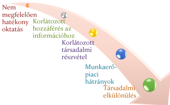
1. ábra: A siketek jelenlegi helyzete Magyarországon

Hazánkban a siketek oktatásának két módja van: szegregált speciális vagy integrált iskolába járathatja a szülő a gyermekét. A két intézménytípusban azonban azonos ideológiai keretben, azonos módszertani alapelvek szerint folyik az oktatás: kizárólag az auditív-verbális/orális módszer használatos. E módszertani gyakorlat keretében a magyar jelnyelv oktatási nyelvként történő használata nem engedélyezett, illetve nem támogatott. A jelnyelv mint tantárgy is csupán a speciális